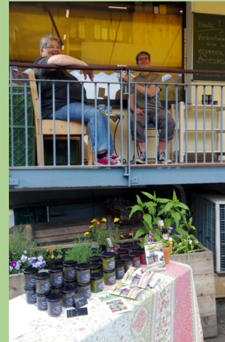
Die Losseküche mit einem Verkostungsstand beim Mitgliederladen Querbeet in Nordshausen.

In 2024 gab es schöne Aktionen: Siehe rechte Seite.