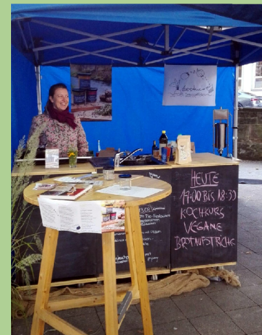
VHS-Kurse für vegane Aufstriche wurden angeboten. Auch wieder in 2025.